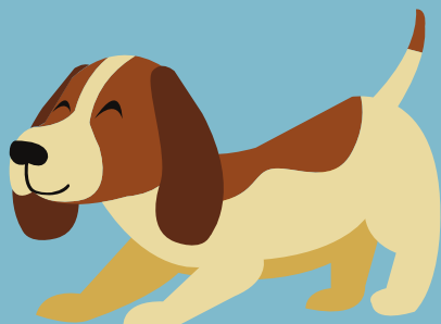
JUEGO Y ACTIVIDADES