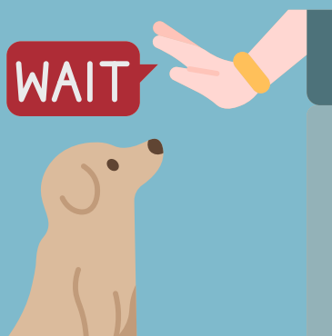
CONTROL Y AUTOCONTROL