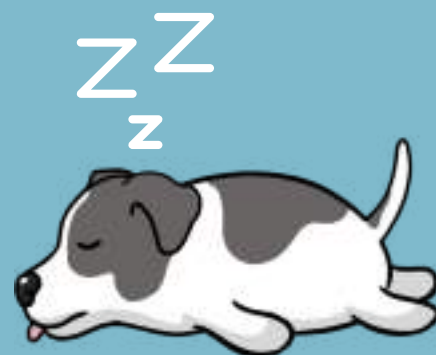
INICIACIÓN DEL PERRO SUELTO