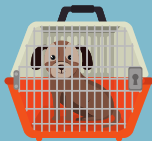
MOVILIDAD Y TRANSPORTE