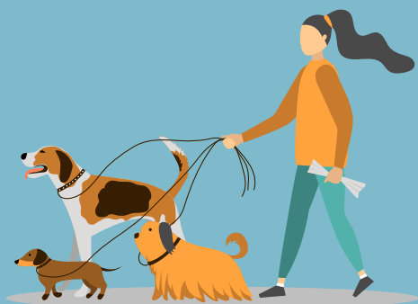
PASEO Y MANEJO DE LA CORREA

Por esto, a través de seis módulos formativos, tu perro y tú conseguiréis un vínculo alucinante, y, lo más importante, contarás con pautas para convivir con un compañero obediente, adaptado a la ciudad y con recursos para relacionarse mejor con otros perros y personas.