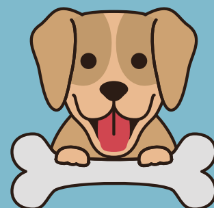
ESTIMULACIÓN Y ENRIQUECIMIENTO